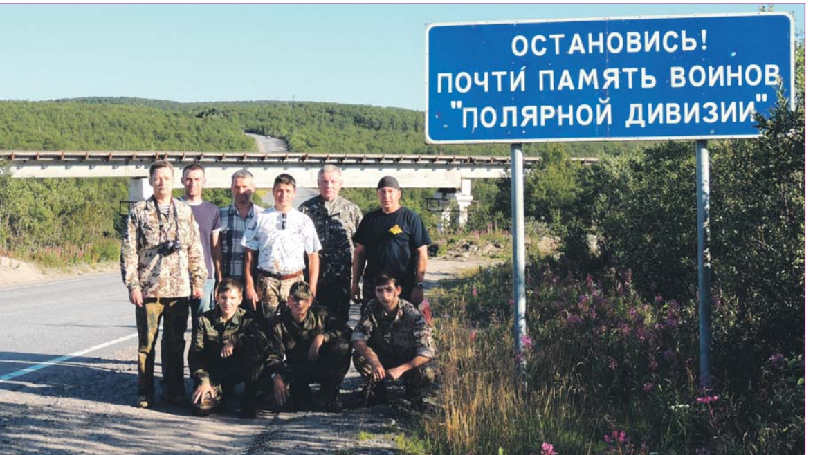
Дальше немец не прошел! Чертов перевал. 60 км от Мурманска, 2013 г.

сопки, надо быть предельно осторожным, внимательным и строго соблюдать дисциплину».