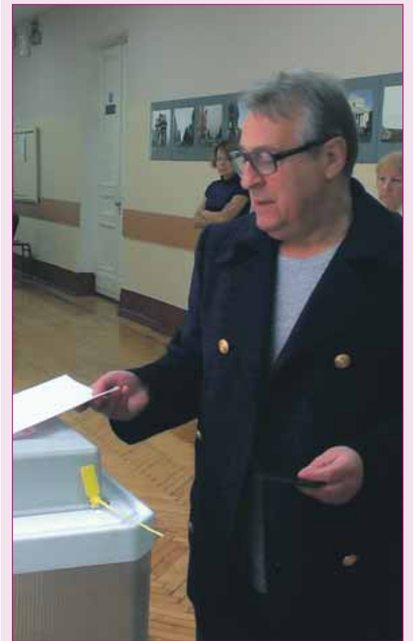
Известный актер ГЕННАДИЙ ХАЗАНОВ:

— Мне даже в голову не приходило не прийти на выборы. Я коренной москвич, всю свою жизнь я прожил в этом городе, и мне не безразлично, что здесь будет происходить. Мне кажется, что это так естественно, что человек идет на участок и отдает свой голос, ничего в этом удивительного нет. Мне кажется, это норма.