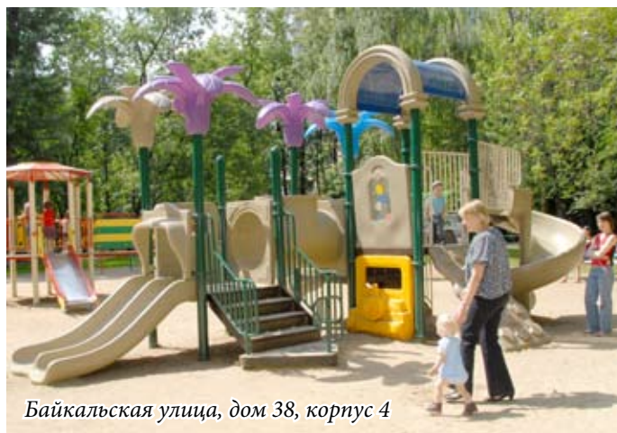
Байкальская улица, дом 38, корпус 4

Словом, работа ведётся большая, а вот и оценка ей. Наш корреспондент Наталия Минкс побывала на обновлённой детской площадке, размещённой возле дома № 38 (корп. 4) по Байкальской улице, излюбленном месте пребывания малышей из ближайших домов.